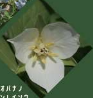
オオバナノ インレイソウ