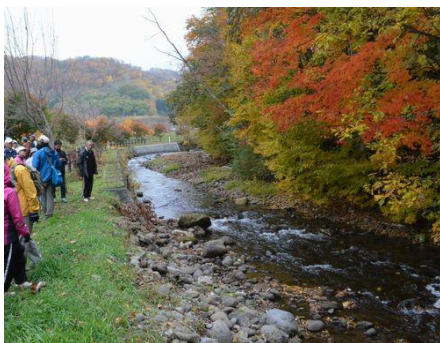
秋のソウベツ川。サクラマスが遡上します。