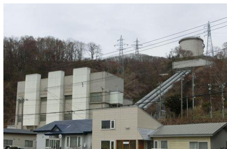
虻田発電所。海と湖の高低差 (84m) を利用し、昭和 14 年から水力発電が行われています。

洞爺湖に集まった水は、サクラマスやヒメマス、コイ、ワカサギ、フナ等の生き物を育み、また飲料水としても利用されています。さらに、噴火湾に近く、海と湖の高低差があることから水力発電にも利用されています。