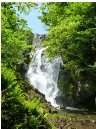
自然の流出口、壮瞥滝。 滝の近くまで歩いて行けます。