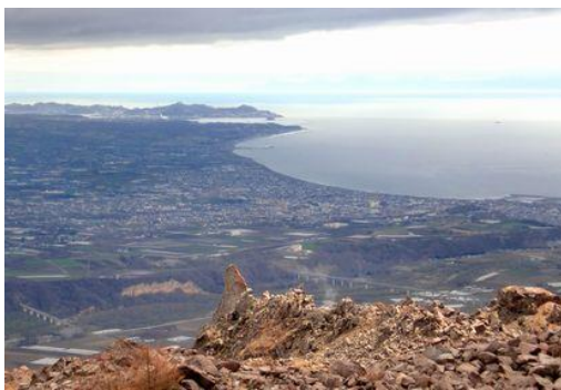
有珠山山頂から見える噴火湾(右)と伊達市の街並み。

伊達市、豊浦町、洞爺湖町は、噴火湾に接しています。普段、海を目にする方も多いのではないのでしょうか。一番身近な海であるこの噴火湾は、実は多くの特徴がある不思議な海でもあります。そのいくつかをご紹介します。