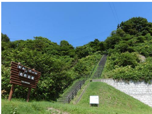
約 130 段の階段を上ると、東屋があります。

ジオパークとは「地球と生命とのつながりを楽しく学べる地域」のこと。洞爺湖有珠山ジオパークは、火山活動を繰り返す地域での暮らしや知恵を学べるジオパークです。