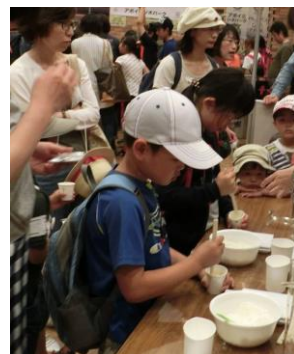
石のでき方をよく聞いて、小麦粉と水で、「軽石」づくりに挑戦!