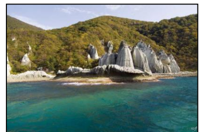
仏ヶ浦 如来の首、五百羅漢、一ツ仏、親子岩、十三仏観音岩、大電石、蓮華岩、地藏堂、極楽浜などの岩々が並ぶ。