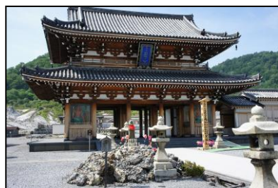
恐山 比叡山、高野山とともに日本三大霊山に数えられる。