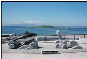
マグロモニュメント(大間) 平成 6 年に水揚げされた 440 kg のマグロ実物大モ ニュメント

毎年、日本のジオパーク認定機関である日本ジオパーク委員会には、日本と世界ジオパークを目指す地域からの認定申請が届きます。今年も新たに「くにびき(島根県)」と「十勝岳(北海道)」の 2 地域が日本ジオパークへの認定を目指しています。