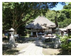
1822 年の噴火災害を伝える 有珠善光寺（伊達市）