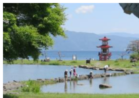
カルデラ壁が崩れ島になった 浮見堂（洞爺湖町）