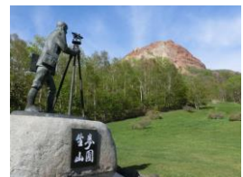
麦畑から誕生した昭和と新山 （壮瞥町）