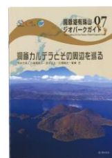
ジオパークガイド

小学生～高校生向け野外学習テキスト 「火山編」「歴史文化編」「植生回復編」 地元で暮らしていても知らなかった見どころ・学びどころを紹介。 データはHPでも公開しています。