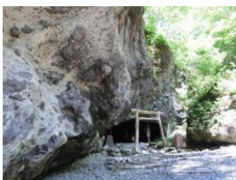
300 万年前の火山活動の証 小幌洞窟（豊浦町）