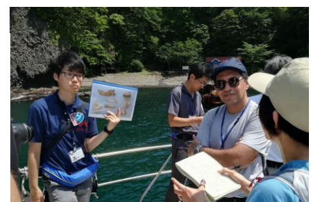
船上からの小幌洞窟見学