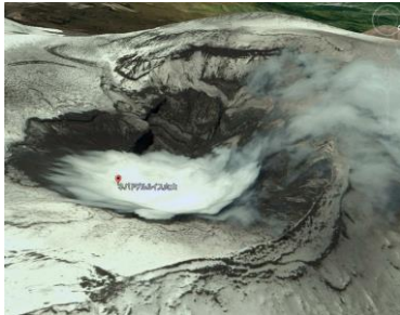
ネバド・デル・ルイス火山の火口部

コロンビアのネバド・デル・ルイス火山は、山頂部が氷河で覆われた、標高 5,399m の高い山です。1985 年 11 月、ここで噴火が始まりました。