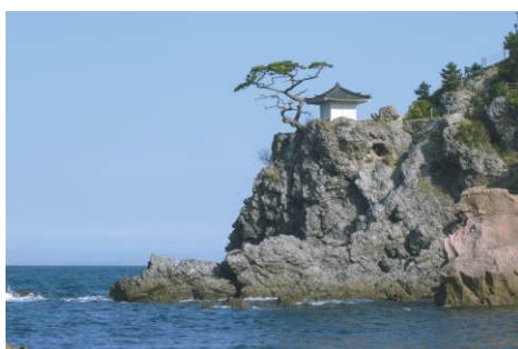
おおいた姫島ジオパーク 観音崎

2019 年 11 月に大分県で日本ジオパーク全国大会が開催されました。大分県には 2 つのジオパークがあり、火山活動で生まれた大地や島々を見ることができます。洞爺湖有珠山ジオパーク推進協議会では、ポスター発表やブース展示を通じ、ジオパークの取組を紹介しました。