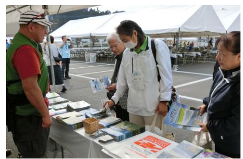
ブース展示の様子