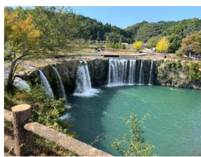
おおいた豊後大野ジオパーク 原尻の滝