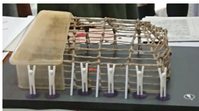
柱の穴から復元された模型