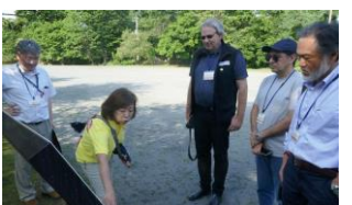
有珠善光寺自然公園