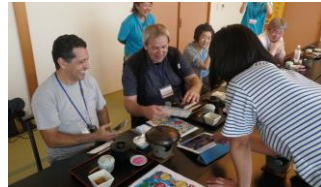
天然豊浦温泉しおさい