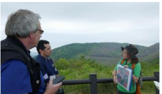
有珠山火口原展望台