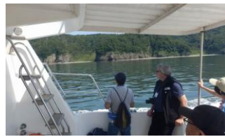
噴火湾(豊浦町海岸)ツアー