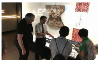
だて歴史文化ミュージアム

現地審査では、ジオパーク内の見どころを巡り、地形の成立と、そこで育まれた文化や産業の実際の姿を見てもらいました。