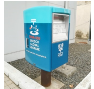
郵便ポストラッピング

この一環で、6月21日(月)、郵便局からジオパークの4つのまちの特産品をデザインした「洞爺湖有珠山ジオパーク 大地の恵み フレーム切手」が発売されました！