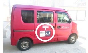
ステッカーの貼付け(白丸部分)