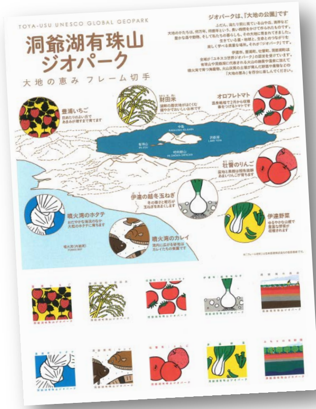
切手シートのイメージ

新型コロナウイルス感染症の影響で、親戚や友人に、会いに行けない状況が続いています。スマートフォンでも連絡はできますが、地元の特産品をデザインした切手を貼って、手紙やはがきで、あなたの気持ちを伝えませんか？