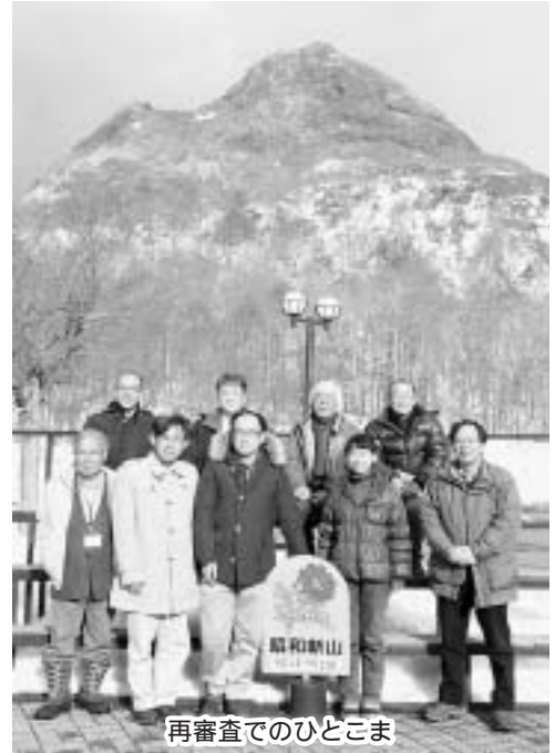
再審査でのひとこま

来年に控えた世界ジオパークネットワーク(GGN)の再審査に先立ち、11/28、29に日本ジオパークの再審査が行われました。ジオサイトの視察や意見交換の中で、観光協会や地元企業による、ジオパークを活用した取組みが評価されたほか、審査員のみなさんからは、観光活用と地域振興の手法や自然遺産の保全について、世界にむけての貢献が求められていること、それを実現するために何をすべきか等、具体的な助言をいただきました。