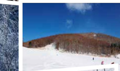
町民に親しまれる船見台スキー場