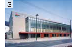
1. 豊浦町国民健康保険病院 2. ふるさとドーム 3. 地域交流センター「とわにー」