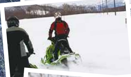
広大な雪原でスノーモービル