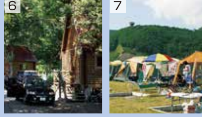
1. 天然豊浦温泉しおさい 2. 豊浦海浜公園 3. 道の駅とよら 4. 噴火湾展望公園 5. 豊浦渚パークゴルフ場 6. 豊浦町森林公園 7. 豊浦海浜公園キャンプ場