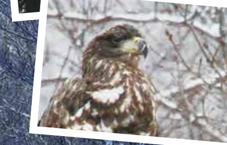
天然記念物のオジロワシ