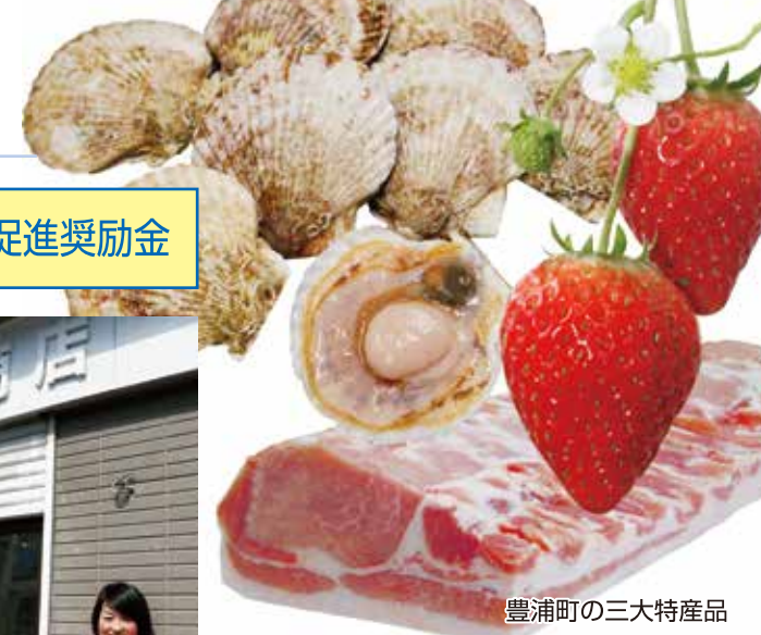
豊浦町の三大特産品 噴火湾養殖ホタテ 豊浦いちご SPF豚肉