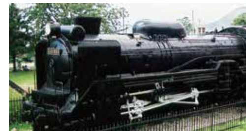
▲海や森はもちろん、SLが目前にある公園もあり、町内には子ども遊び場が豊富にあります。