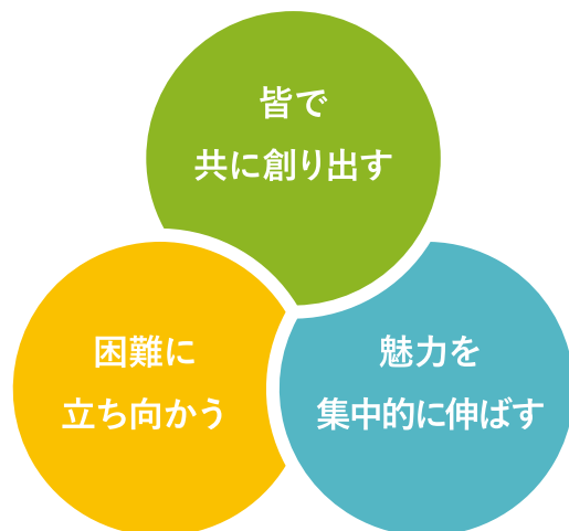
基本姿勢のキーワード