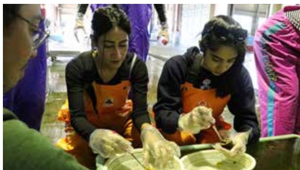
▲真剣な表情でウニの殻をむいています。