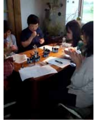
▲アロマ ワークショップ

まだ、未熟ではありますが、私なりに頑張っていきたいと思いますので、応援よろしくお願いいたします。