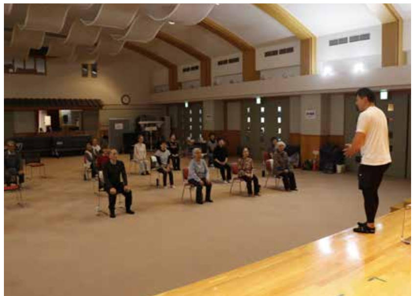
▲しおさいで行われている「はつらつ運動教室」

皆さんから回答いただいた結果と、豊浦町の現状を合わせて分析したものを中間評価として取りまとめました。その中から抜粋し、次ページ以降で紹介いたします。