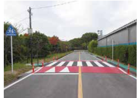
▲スムーズ横断歩道の参考写真