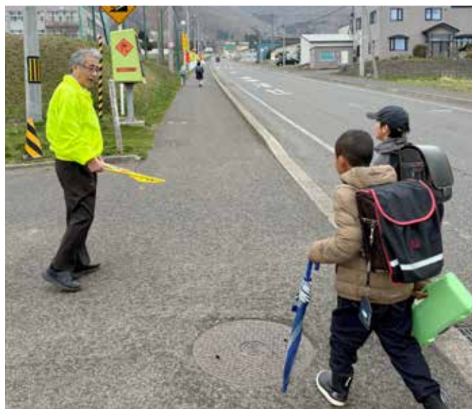
町長に見守られ元気に登校する豊浦小学校児童

街頭啓発にご協力いただいた自治会の皆さま、朝早くから本当にありがとうございました。